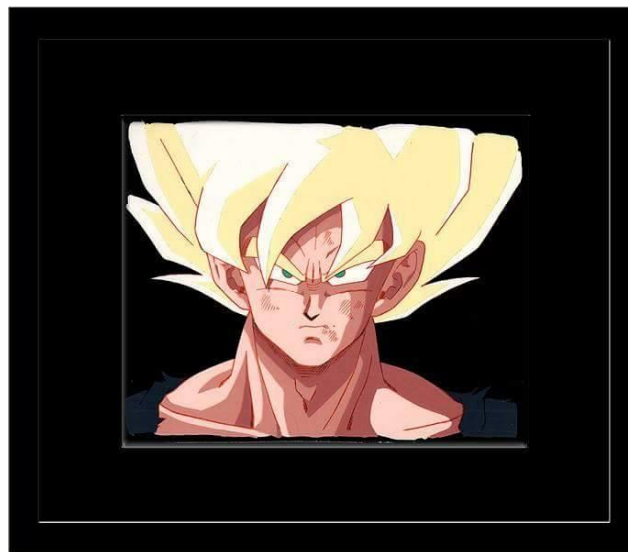
Dragon Ball Z - © 1989 – d'après l'oeuvre de Akira Toriyama / Toei Animation