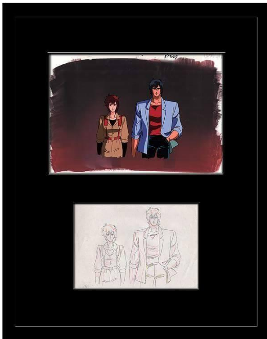
Nicky Larson - © 1988 – d'après l'oeuvre de Tsukasa Hojo / Sunrise