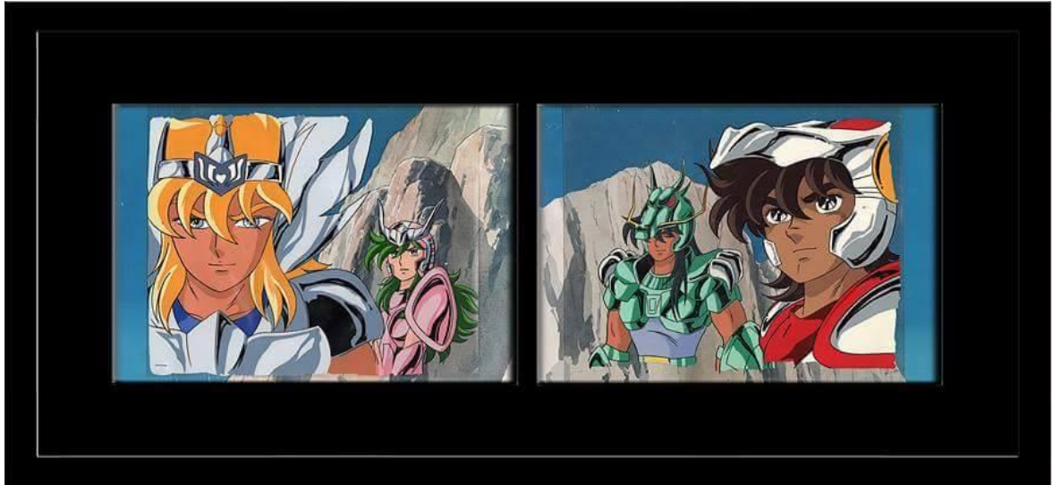
Les Chevaliers du Zodiaque - © 1986 – d'après l'œuvre de Masami Kurumada / Toei Animation